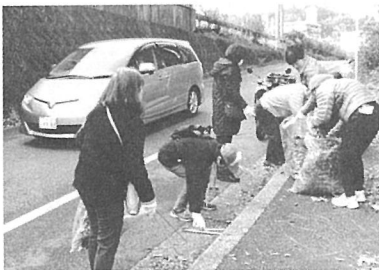
バイパス側道の清掃