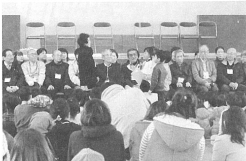
1年生から講師へお礼のプレゼント

体育館で約1時間半という短い時間でしたが、遊び方のコツを伝えました。初めての遊びに戸惑う子がいたりの、