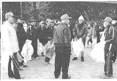
担当地区ごとに打ち合わせ