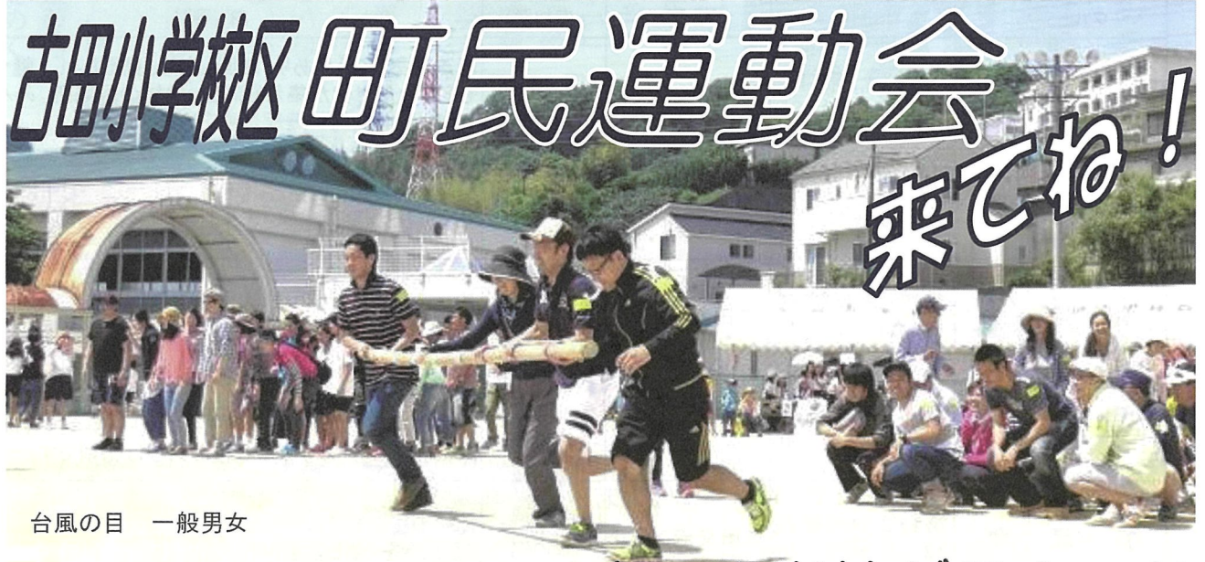
台風の日 一般男女

古田学区 人口: 12,561 人 世帯数: 5,173 世帯 (1月末現在) 古田学区社会福祉協議会 広報委員発行 発行責任者 西本幸男 (☎299-5559)