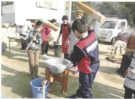
ぎこちない手つきで杵を振る 東町

もち米を蒸すにおいが漂う中、蒸しあがったもち米は臼にいれられ、町内のベテランの指導をうけながら、子ども会の保護者ももちつきをしました。子どもたちはほとんどもちがつきあがった状態になってから、杵を振り下ろしました。つきあがったもちは、小さく丸められ、黄な粉やだいこんおろしなどをつけて食べました。