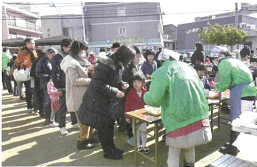
多くの人で賑わう 新町

公園内には、テントやテーブル、椅子が設営されました。新町子ども会と子ども民謡クラブの太鼓演奏・唄もありました。新町以外の参加者もあり、賑わっていました。